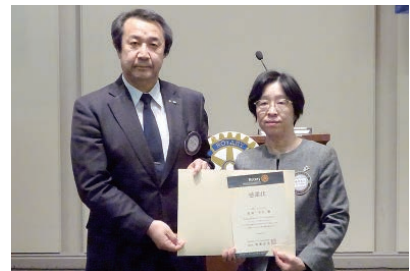
■カウンセラー感謝状