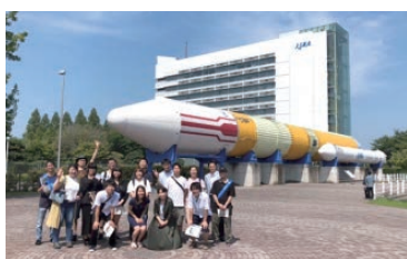
JAXA 筑波宇宙センター前にて

2019年6月28日の優良ローターアクト表彰式では当学院ローターアクトクラブからも優良メンバーが選ばれ、とても誇らしい気持ちです。