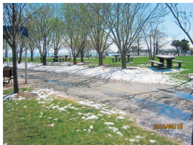
ミシガン湖畔の公園