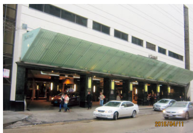
Chicago Marriott Downtown Magnificent Mile

2016年規定審議会は、2016年4月10日より15日まで Hotel Chicago Marriott Downtown Magnificent Mile において開催された。