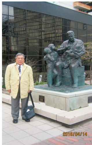
ロータリー本部 エバンストン

審議会の行った決定が、クラブにより一時保留とされない限り、制定案は審議会閉会直後の 7 月 1 日にその効力を生じる。 RI 理事会は、規定審議会が閉会してから 1 年以内に、審議会によって採択された決議に関わる全ての理事会決定について、全ガバナーに通知する。